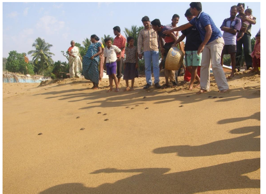
कासवांची पिल्ले समुद्रात सोडण्यासाठी स्थानिकांचा सहभाग