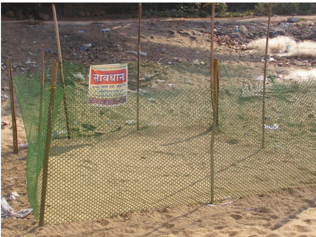
कासवांच्या घरट्यांच्या संरक्षणासाठी संरक्षक जाळी